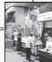
「スシマス」と 「渚齒科」の間の道を 右折するともうすぐ