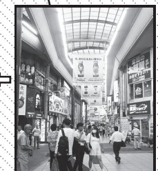
西口を出て アーケードを抜けると 大きな横断歩道が