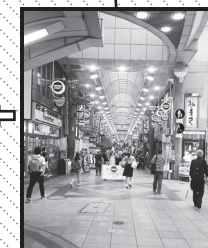
横断歩道を渡って 十三フレンドリー商店街 入り口はこんな感じ