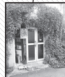
カフェスロー大阪到着！ 立派なツタの葉が目印です